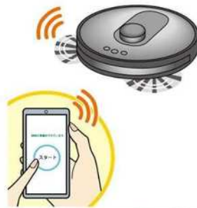
スマホと連動できるタイプなら、お出かけ中でもスマホからスタート！

て以上の家でも各階に持ち運べば掃除してくれるので、掃除の時間を軽減することが出来ます。 ・掃除範囲によって機種を選べる…コンパクトな部屋を掃除するなら、一般的なタイプで十分。複数の部屋を掃除する場合は、部屋の間取りを認識できる内蔵のセンサーがついたタイプがおすすめてです。 ・拭き掃除ができるタイプも…ゴミを吸い込んだ後に拭き上げるため、雑巾がけの手間が省けます。