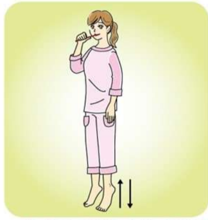
つま先立ちは、食器洗いなどの家事や歯磨き中にやってもOKです！

下半身に巡る血液を心臓へ戻すポンプのような役割を果たしています。ふくらはぎの筋肉を使ったエクササイズで血液の巡りを良くしましょう。 ●つま先立ちストレッチ：5〜10秒、かかとを上げておろす動作を10回ほど。音楽のリズムに合わせて、左右交互にかかとの上げ下げをやるのもおすすめです。楽しみながらできます。